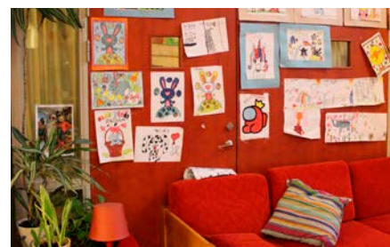
Elevernas teckningar pryder väggarna på Skogsängsskolan.