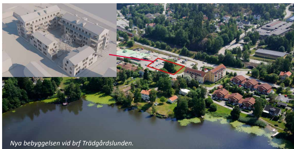
Nya bebyggelsen vid brf Trädgårdslunden.