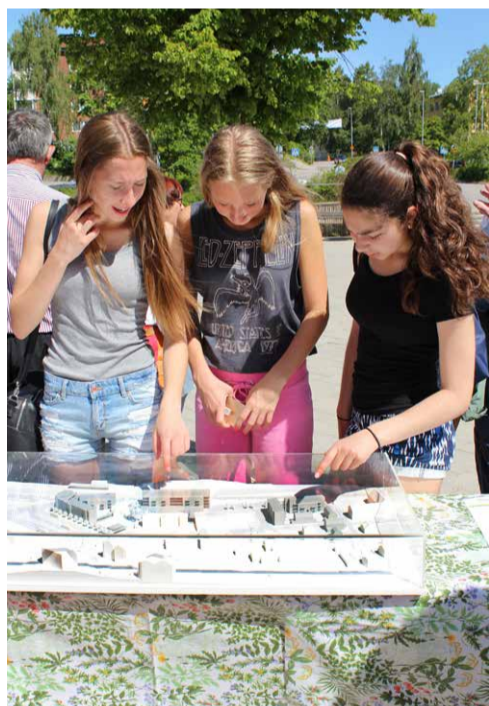
Lördagen den 13 juni gick startskottet för omvandlingen av Rönninge centrum.